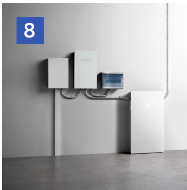
8 Activación e instalación del contador