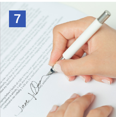
7 Contratación del nuevo suministro a la comercializadora