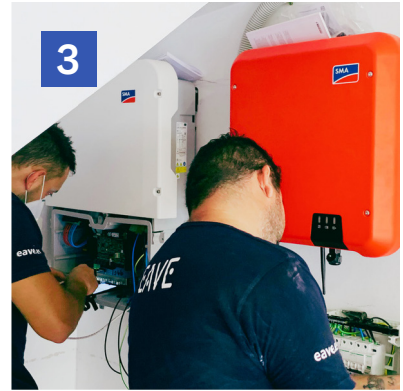
3 Adecuación del contador