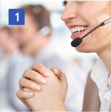
1 Contacto inicial

Se da de alta un nuevo suministro y se realiza lo siguiente: