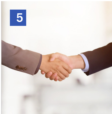
5 Acuerdo y autorización con la comunidad