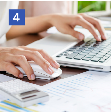
4 Gestión y consulta con la compañía suministradora