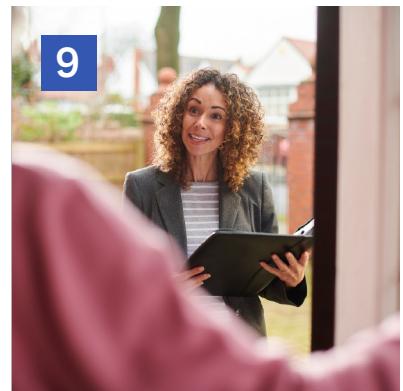
9 Visita de comprobación de EAVE