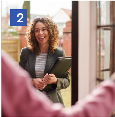
2 Visita de nuestro experto