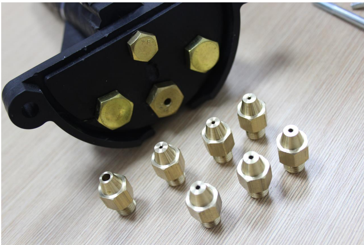
Набор сменных латунных дюзов.

Новая модель штукатурного Ковша изготовлена по технологии трансформер "три-в-одном" и поставляется сразу с двумя сменными плашками сопел в комплекте: с одним и тремя соплами.