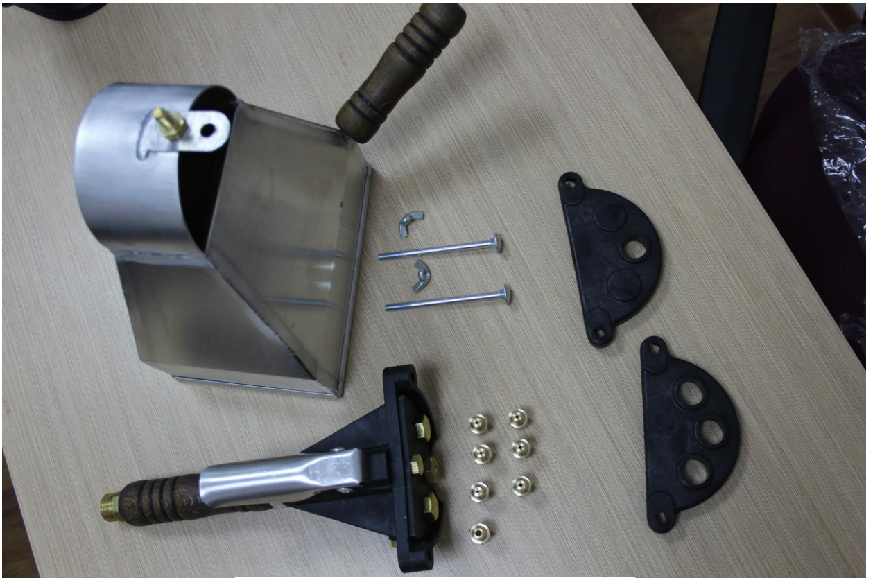
Ручки деревянные – бук мареный